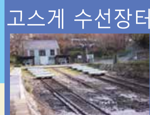
미쓰비시 나가사키 조선소